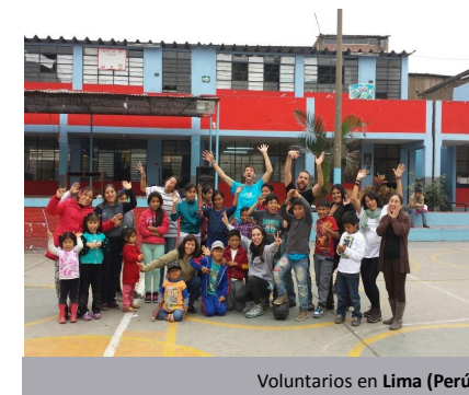
Voluntarios en Lima (Perú)